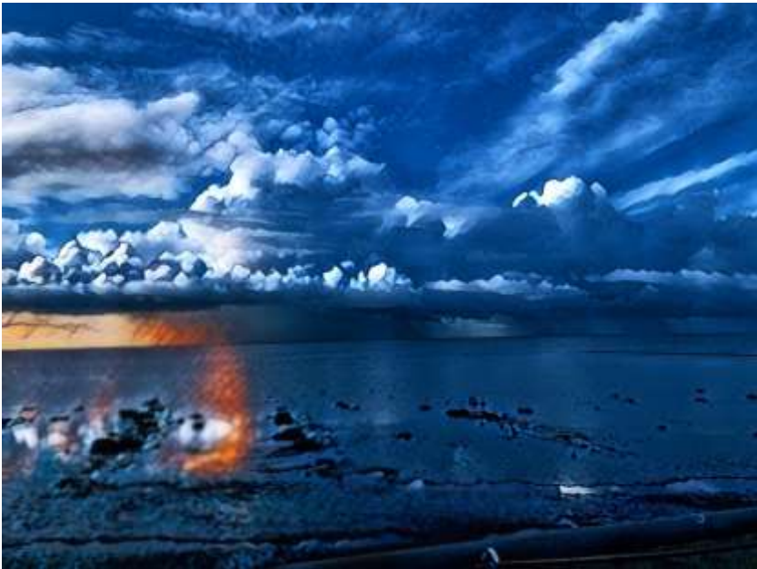
Ankunft- Blick vom Hindenburgdam