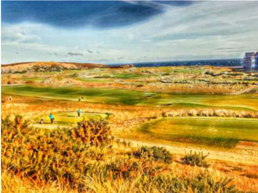
Budersand - Golfertraum