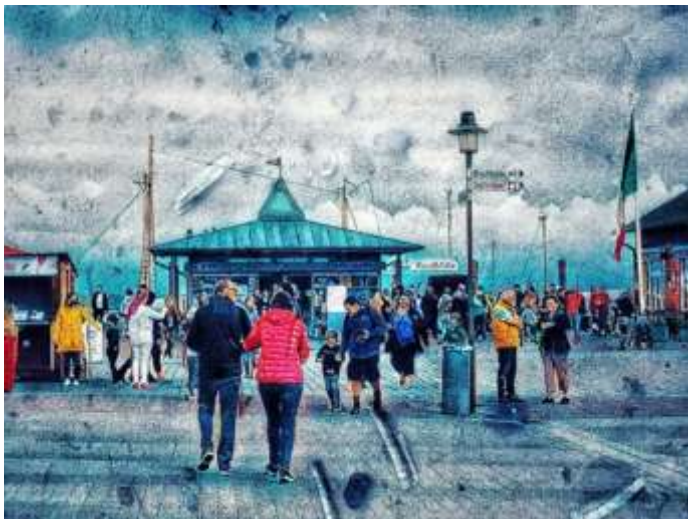
Gosch List Eingangsbereich

Warten vor den Kneipen, raten: Lassen sie uns rein, dürfen wir heute dabei sein, oder müssen wir vergeblich frieren vor verschlossenen Türen mit Masken bewaffnet, den Abstand beachtend, weil zu viele andere haben reserviert und nicht genügend vor uns in der Schlange haben resigniert. Das ist der Sylter Corona Sommer 2020.