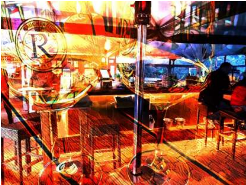
Kampen-blaue Stunde im „Rauchfang“